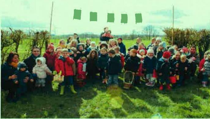
48 Enfants inscrits