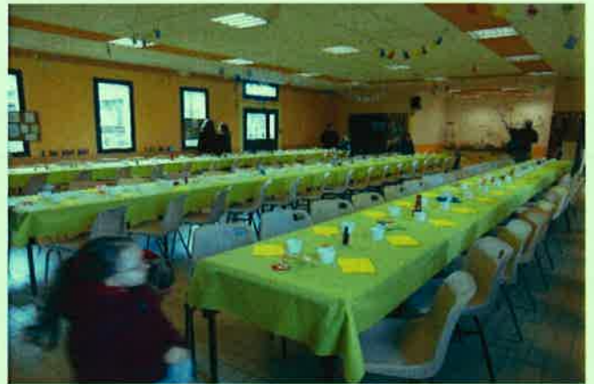
décoration de la salle réalisée par la commission des fêtes