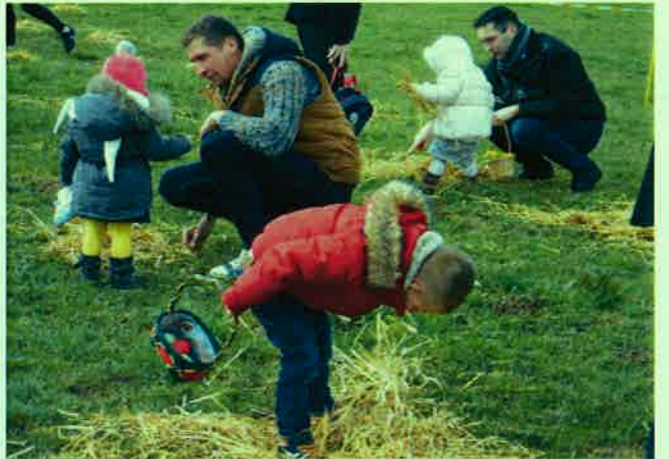
où sont ils cachés !!!