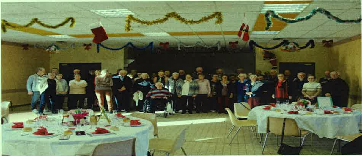
Repas des aînés "56 personnes ont répondu présent à cette invitation"