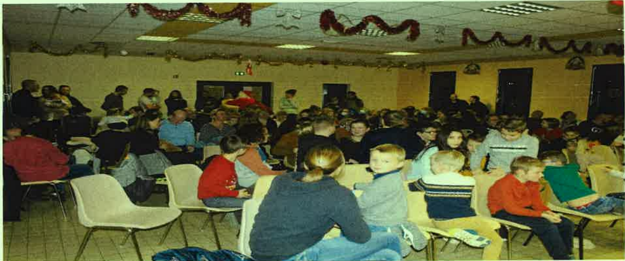
Arbre de Noël « spectacle interactif » 72 enfants inscrits